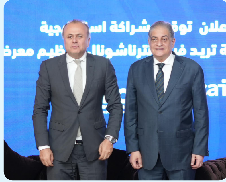
إعلان تودة شراكة استراتيجية مع تريد فيرز إترناشونال لتنظيم معرضي Cairo ICT و CaISEC

ويوقع عقد الشراكة تشارك الشركة المتحدة للخدمات الإعلامية، في تسويق Cairo ICT و Caisec محلياً وإقليمياً وعالمياً لجذب كبرى الشركات العاملة بقطاعات الاتصالات وتكنولوجيا المعلومات والأمن السيبراني، وتنظيم حملة إعلامية ودعوة الجهات المحلية والعالمية للمشاركة وعرض منتجاتها، وإقامة شراكات، والاستفادة من الفرص الواعدة بالسوق المصري، مستهدفة أن يصبح المعرضين أكبر منصات تطرح أحدث الابتكارات