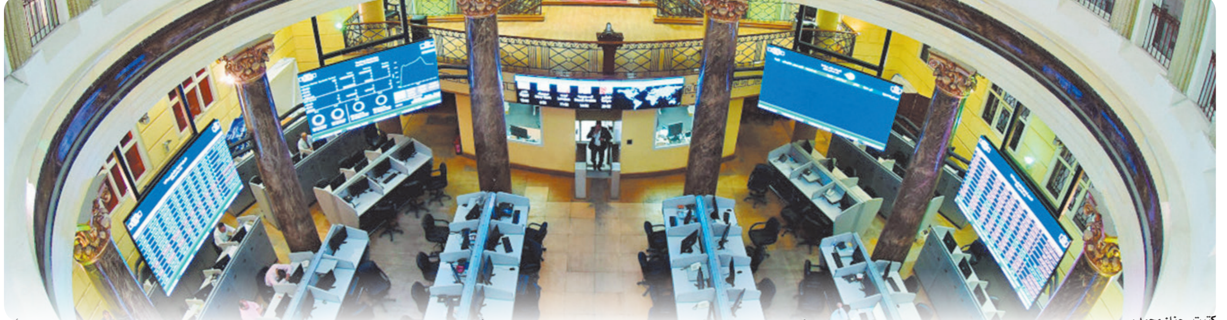
كتبته- حنان محمد:

بدء تنفيذ برنامج الطروحات الحكومية ضرورة لجذب مزيد من رؤوس الأموال